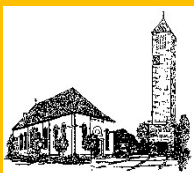
Pfarnachrichten für Lönigen, St. Vitus

Die Suchtselbsthilfegruppe Kreuzbund St. Petrus Lastrup trifft sich im Dezember am Montag, 01.12.2025, am Montag, 15.12.2025 und am Montag, 29.12.2025 jeweils um 19.30 Uhr im „Haus der Begegnung“, Pfarrheim St. Petrus, Wallstraße 8, Lastrup. Erstinformationen können gerne telefonisch unter ☎ 0157-72951840 oder per E-Mail unter kenkelmarkus@gmail.com erfragt werden.