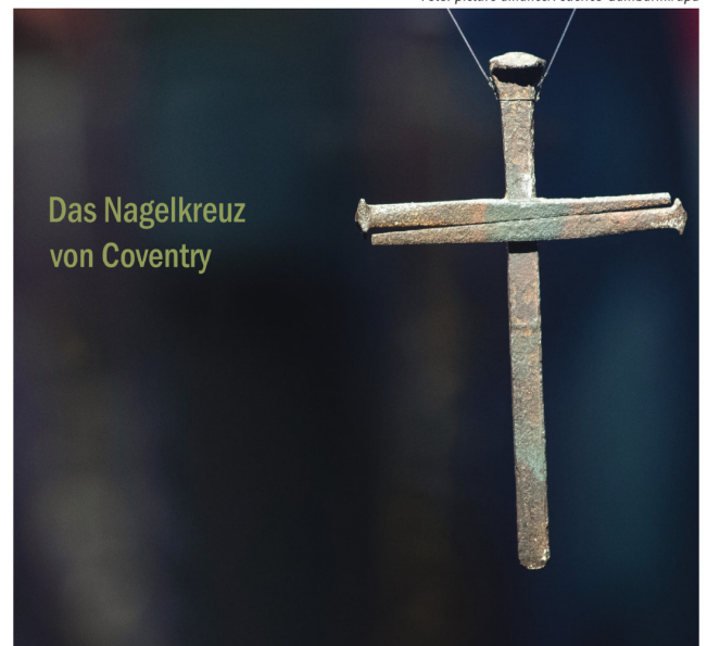
Das Nagelkreuz von Coventry